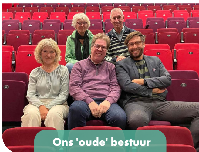
Ons 'oude' bestuur