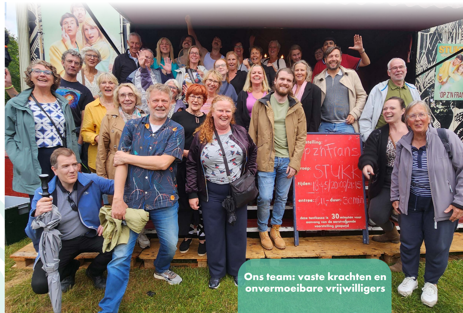
Ons team: vaste krachten en onvermoeibare vrijwilligers